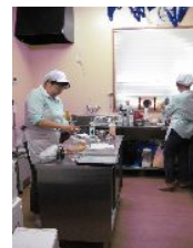
ケーキ作りの工房もあるんです。