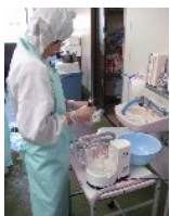
ソイミートの袋詰め作業です。