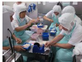
おからの袋詰め作業です。みんな真剣に取り組んでいます。