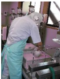
もめん豆腐作りの作業中。