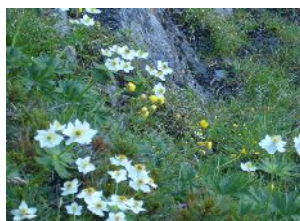
寄せ植えのように各種の花が咲き競っています。