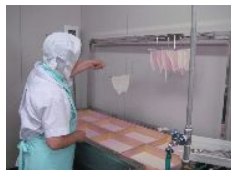
ゆばを作っています。絶品です。