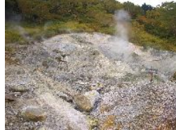
湯煙が上がっています。