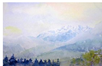
「駒ヶ岳」 前回の展示作品です。