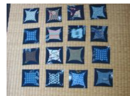
完成品です。 (「岳」の人気商品)