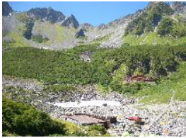
溜沢より溜沢岳、北穂

9月は単独で穂高へ。初日は一気に穂高岳山荘へ。ちょっと頑張りすぎたので、ザイテングラードでギブアップ寸前。火事場のくそ力でなんとか山荘へ。翌日は小雨の中、奥穂登頂。前穂はあきらめ往路で上高地へ。ひさびさにハードな山でした。