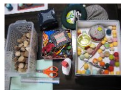
おなじみ、フェルトの可愛い作品です。木の台も全て手作りです。