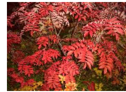
色鮮やかなナナカマド