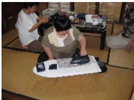
一枚一枚ていねいに作ります。