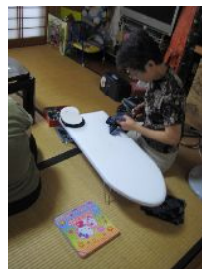
ボランティアさんも真剣です。