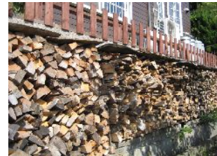
自然にやさしい燃料です