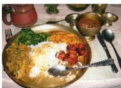
具沢山カレー(宮廷料理なんです)