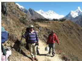
休憩中(後方にアマダプラム)