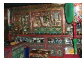
ロッジにある極彩色の仏壇