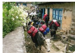
装備は牛さんが運びます。