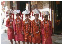
街のお祭りで出会った少女達