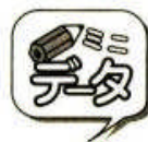
【北方4島の面積と人口】