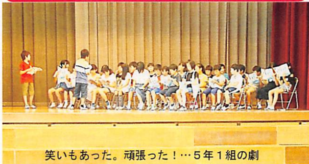
笑いもあった。頑張った！…5年1組の劇

7月9日(月)、児童集会で「お楽しみ会」を行いました。今回は、有志発表を全校で楽しむという企画でした。事前に発表希望者を募集したところ、劇やクイズ、ダンスなど、たくさん有志が集まりました。よく考えたのクイズです！